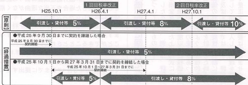
【図2】 旧税率を適用する経過措置

税率の改正日を跨ぐ事業年度では、複数の税率が混在します。財務会計等のシステムが対応できるか確認しておく必要があります。